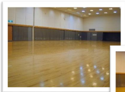
小アリーナ 上：1, 2両面 右：小アリーナ1